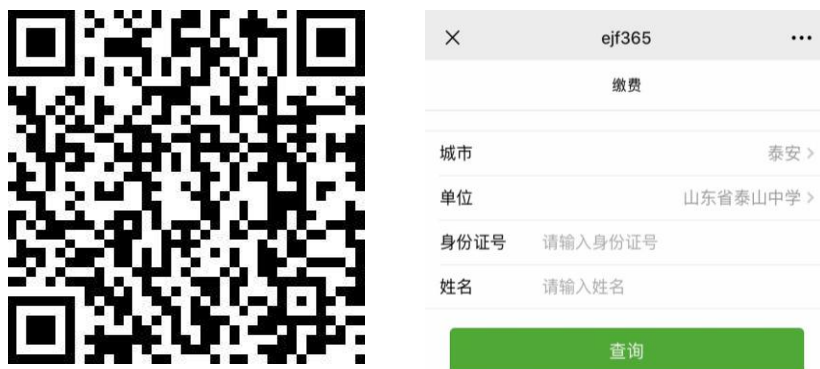
图 1 缴费页面