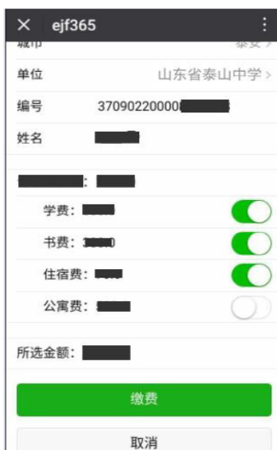
图 2 选择缴费项目