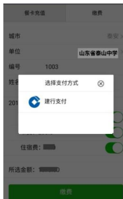
图 3 选择支付方式