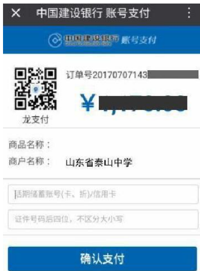
图 4 输入建行账号、身份证号码后四位

4、选择【建行支付】，进入建行付款界面，输入建行账号、预留开卡人身份证号码后四位，点击【确认支付】，系统会向开卡时预留手机号发送验证码，此时输入短信验证码完成支付，页面自动跳转为支付成功。如图 4、图 5 所示：